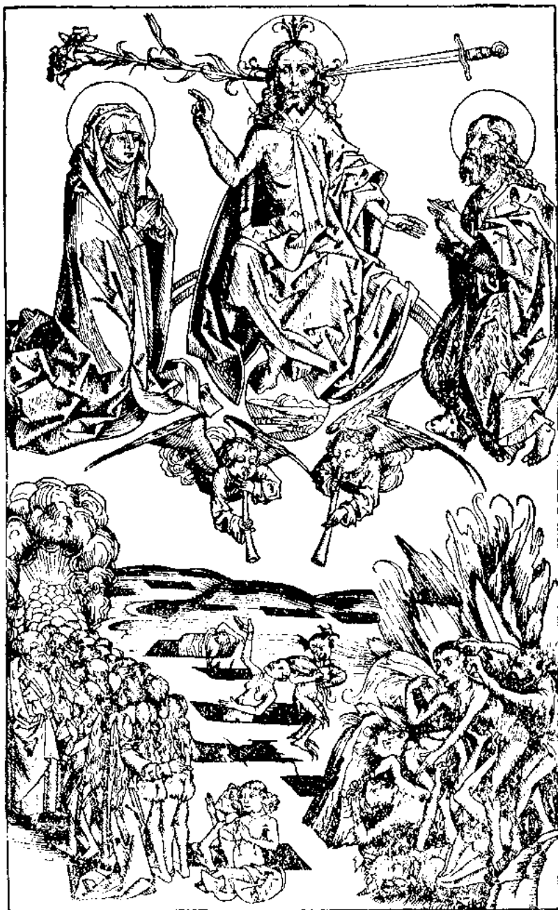
ХРИСТОС-СУДИЯ, ВОССЕДАЮЩИЙ НА РАДУГЕ