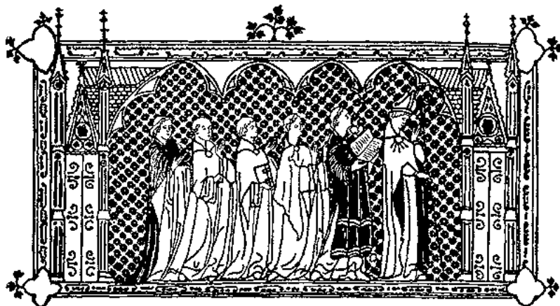
ХОР МОНАХОВ XVI ВЕКА

в монахи. Понадобилось две недели для того, чтобы устроить все дела и решить, в какой монастырь идти. Он избрал обитель с суровыми порядками — реформированную общину августинцев. После прощальной вечеринки с друзьями он явился к воротам монастыря. Известие о решении сына необычайно разгневало отца. Его воспитанный в строгости сын, которому надлежало быть опорой для родителей во дни их старости! Отец совершенно не мог примириться с этим решением до тех пор, пока смерть двух других сыновей не убедила его в том, что это возмездие за его бунт.