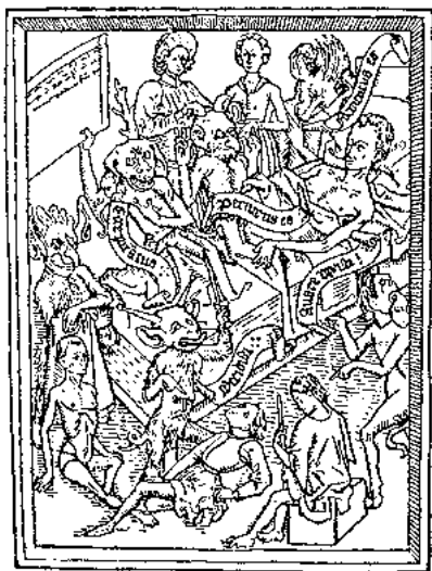
БЕСЫ ИСКУШАЮТ УМИРАЮЩЕГО ОСТАВИТЬ НАДЕЖДУ

есть такое озеро, что если бросить в него камень, то во всей местности разразится буря, поскольку в водах его полным-полно плененных бесов».