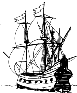
Такелаж — судовые снасти.