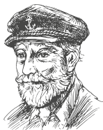
Шкипер — капитан парусного судна.